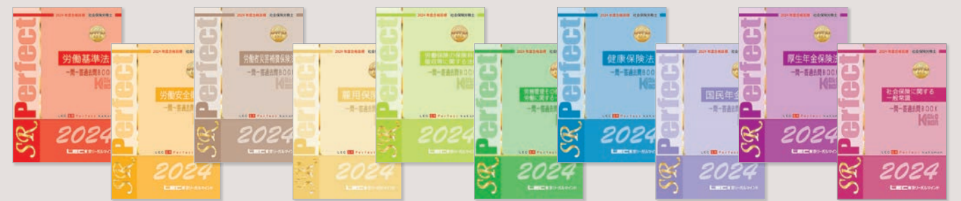
一問一答過去問BOOK(全10冊)